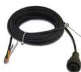
Cavi di congiunzione