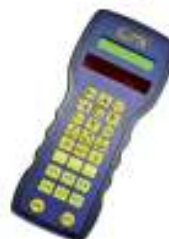
Ripetitore RF AV60