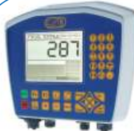
Pesa Advance SP150